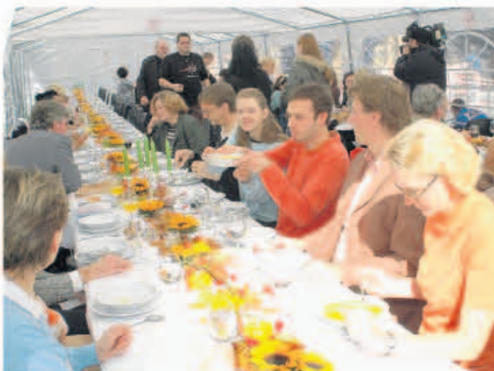
Das „Bankett für Millionen“ fand im vergangenen Jahr zum ersten Mal in Berlin statt.