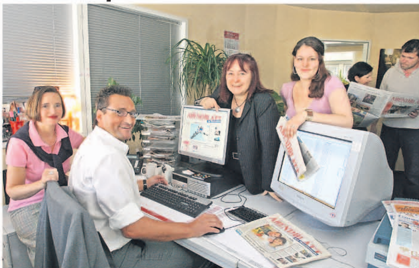
Den letzten Schliff für die Titelseiten unserer ersten Berliner Abendblatt-Wochenendausgabe gab's kurz vor Druckbeginn. Die Meinung aller Abteilungen war gefragt. Wir sind überzeugt, dass Sie, liebe Berliner Abendblatt-Leserinnen und -Leser, mit dem Ergebnis zufrieden sind und das Berliner Abendblatt zukünftig ganz selbstverständlich zu Ihrer Wochenendlektüre zählt.